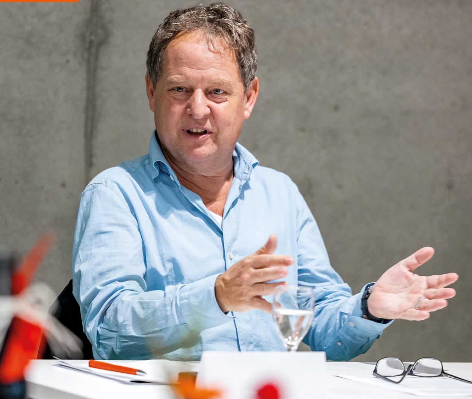
Klares Ziel. Burghausens Erstem Bürgermeister Florian Schneider sind die Herausforderungen für die Jahre 2026 bis 2032 bewusst. Gemeinsam mit dem Stadtrat will er Burghausen fit für die Zukunft machen und die Lebensqualität der Stadt erhalten