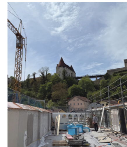
Nach knapp zwei Jahren Bauzeit wird in der Hans-Stethaimer-Schule bald wieder unterrichtet

Die Arbeiten im Bestand waren eine große Herausforderung - das Schulhaus besteht aus verschiedenen Gebäuden unterschiedlicher Epochen, das Hauptgebäude in der Mitte wurde 1929/30 erbaut, die Fassade zum Stadtplatz hingegen stammt in Teilen noch aus dem 15. Jahrhundert. „Unser Ziel bei der Sanierung war es, behut-