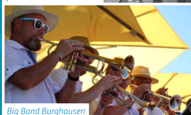
Big Band Burghausen