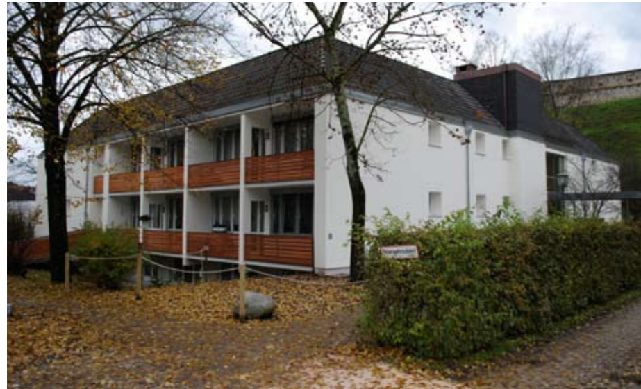
Das Wohnheim (auf dem Foto rechts) liegt unmittelbar neben dem Altenheim Heilig-Geist am Fuß der Burg. Eingebettet sind die Häuser in viel Grün. Zu Fuß ist es ein kurzer Weg in die Altstadt.

Nach knapp neun Monaten Um- bauzeit sind die Appartements im Wohnheim des Heilig Geist-Spitals fertiggestellt. In drei Bauabschnitten wurden alle Räumlichkeiten grund- legend saniert und umgebaut .