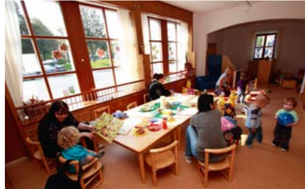
Kinderbetreuung im Haus der Familie

In den letzten Wochen sind über 20.000 € an Spendengeldern für das „Haus der Familie“ in Burghausen eingegangen – dies zeigt, wie diese neue Einrichtung in der Öffentlichkeit beachtet wird und welchen Stellenwert eine Zusammenfassung verschiedenster Organisationen als Anlaufstelle für die Betreuung von Familien hat.