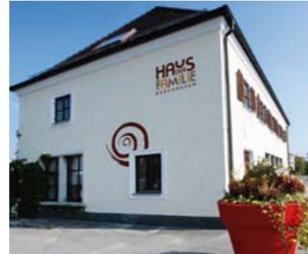
Das Haus der Familie in der Marktler Straße