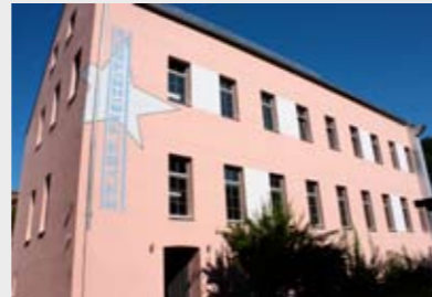
Das Freizeitheim Burghausen

... bei der Modernisierung und Renovierung des Freizeitheims von Januar bis August 2009 rund 1.760 Stunden Arbeitsleistungen von Ehrenamtlichen und Mitgliedern des Jugendrates erbracht wurden?