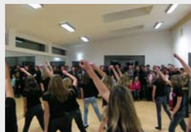
Der neue Trainingsraum

Die Stadt hat hierfür 250.000 € investiert und damit nach Feuerwehrhaus, Schützenanlage, Übungsraum-Georgsbläser auch den Sportverein weiter in Raitenhaslach unterstützt.